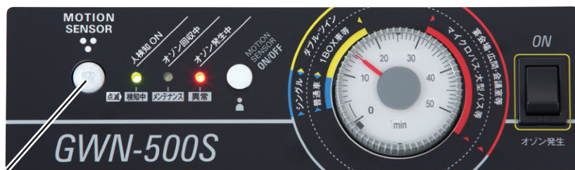
モーションセンサー

多数のユーザー様にご使用いただいている客室、車両での使用をよりわかりやすくしました。女性スタッフでも簡単に操作可能です。